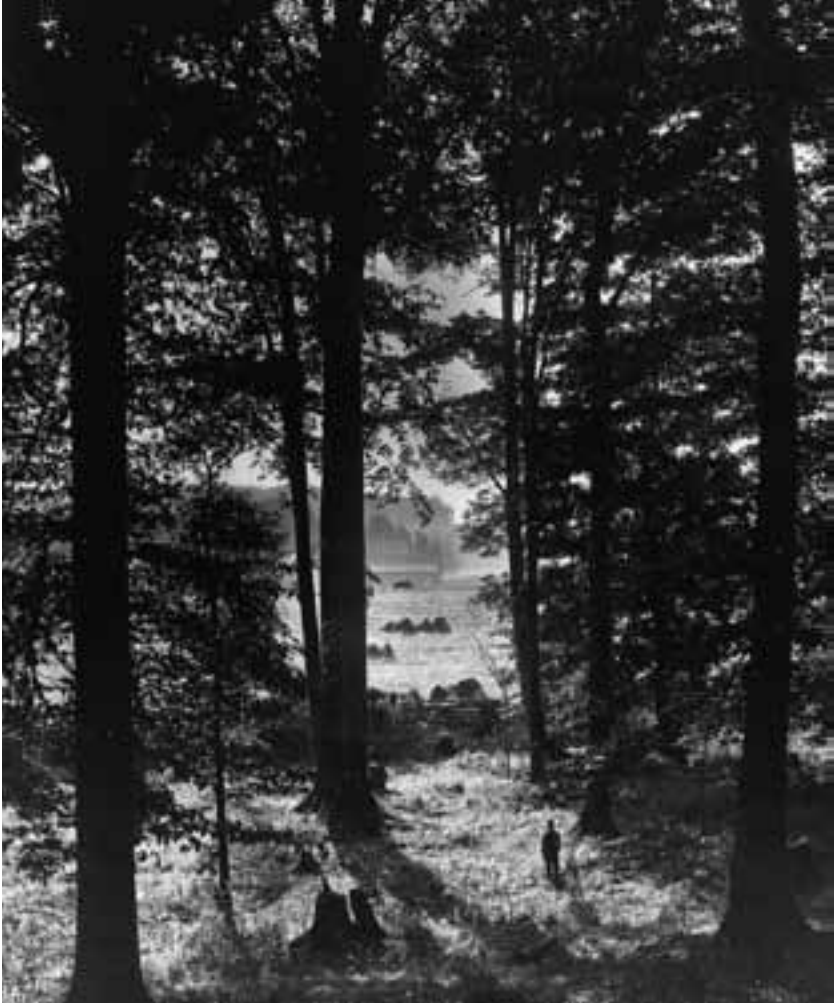
La Arboleda Sagrada aproximadamente en 1907. En la primavera de 1820, el joven José Smith fue a la arboleda cerca de su hogar para orar al Señor y obtener dirección.

religiones de su época, pues “...todas estaban en error” y “sus cre- dos eran una abominación a su vista... enseñan como doctrinas los mandamientos de los hombres, teniendo apariencia de pie- dad, mas negando la eficacia de ella” (José Smith—Historia 1:19). Se le prometió a José también “que la plenitud del Evangelio se [le] daría a conocer en un tiempo futuro” 5 . Después de siglos de oscuridad, tanto la palabra de Dios como la realidad de Dios el