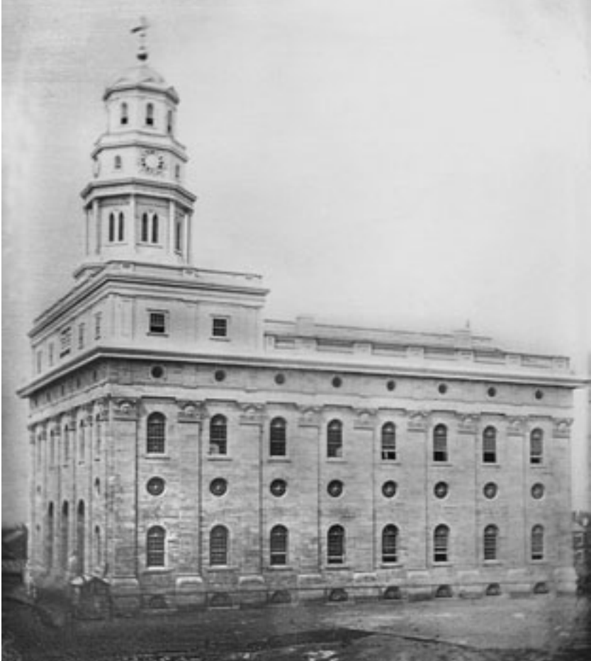
El Templo de Nauvoo a mediados de la década de 1840. El templo se incendió en 1848, después de que se forzó a los santos a salir de Nauvoo. Tiempo después, un tornado destruyó algunas de las paredes, dejando otras muy débiles, las cuales tuvieron que derribarse.

pudieran llevarse a cabo en el templo (véase D. y C. 124:29–31). Durante el verano y el otoño de 1841, los santos construyeron una pila bautismal provisional de madera, en el subsuelo recién excavado del templo. El 21 de noviembre de ese año se llevaron a cabo en esa pila los primeros bautismos por los muertos.