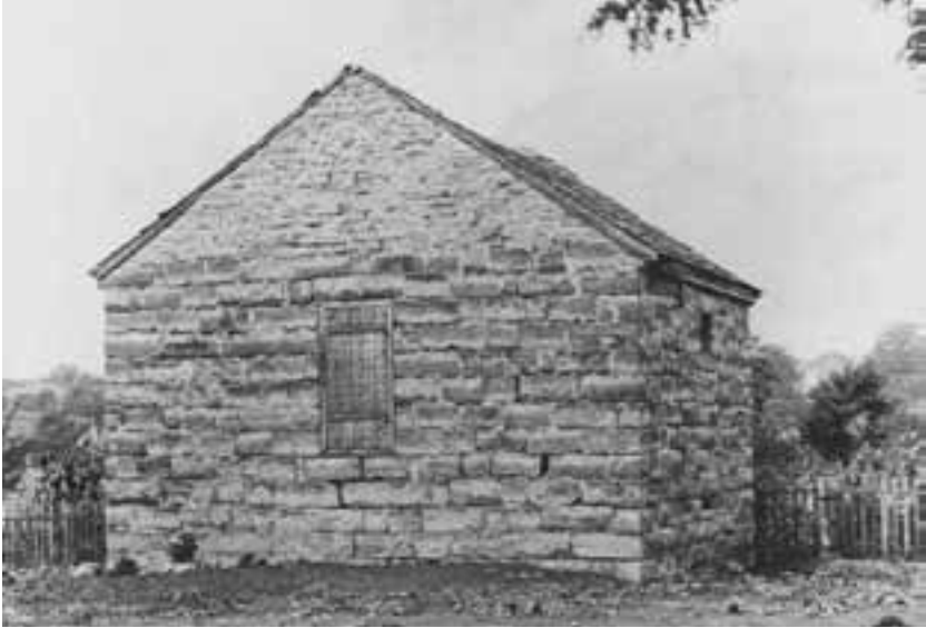
La cárcel de Liberty, donde el profeta José Smith estuvo encarcelado en el invierno de 1838 a 1839.

dirección de Brigham Young y de otros líderes de la Iglesia, se guió a los santos al Este, a Illinois, en busca de refugio.