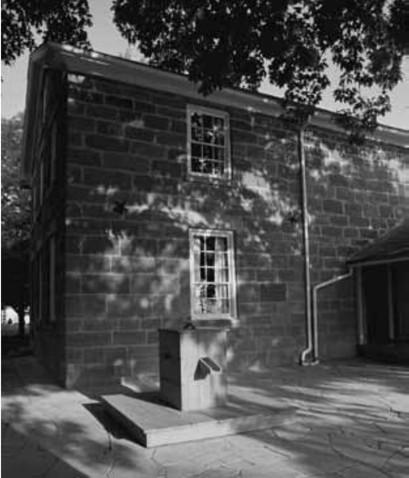
La cárcel de Carthage, donde el profeta José Smith y su hermano Hyrum sufrieron el martirio el 27 de junio de 1844.

Hancock. Cuando el Profeta y su hermano Hyrum llegaron a Carthage, les dieron libertad bajo fianza de ese cargo pero los acusaron de traición al estado de Illinois y fueron encarcelados en la prisión local.