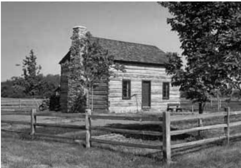
Réplica del hogar de Peter Whitmer, padre, en Fayette, Nueva York. Esta casa reconstruida está situada en el lugar donde el Profeta organizó formalmente la Iglesia el 6 de abril de 1830.

El 6 de abril de 1830, sólo once días después de que se hizo público que el Libro de Mormón saldría a la venta, un grupo de unas sesenta personas se reunió en la casa de troncos de Peter Whitmer, padre, en Fayette, Nueva York. Allí José Smith organizó oficialmente la Iglesia, y después se designó por revelación como: La Iglesia de Jesucristo de los Santos de los Últimos Días (véase D. y C. 115:4). Fue una ocasión de regocijo, con gran manifestación del Espíritu; se repartió la Santa Cena, se bautizó a los creyentes, se les confirió el don del Espíritu Santo y se ordenó