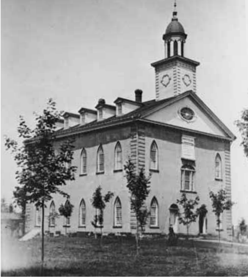
El Templo de Kirtland aproximadamente en 1900. Este templo se construyó con gran sacrificio por parte de los santos, pero tuvo que abandonarse después que la persecución los hizo salir de Kirtland.

junto con muchas otras, se publicaron en Kirtland bajo el título de Doctrina y Convenios.