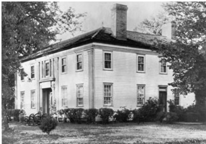
La Mansión de Nauvoo. El profeta José Smith y su familia se mudaron a esa casa en agosto de 1843.

Gran Bretaña se congregaron allí, convirtiéndola en una de las localidades más pobladas del estado de Illinois.