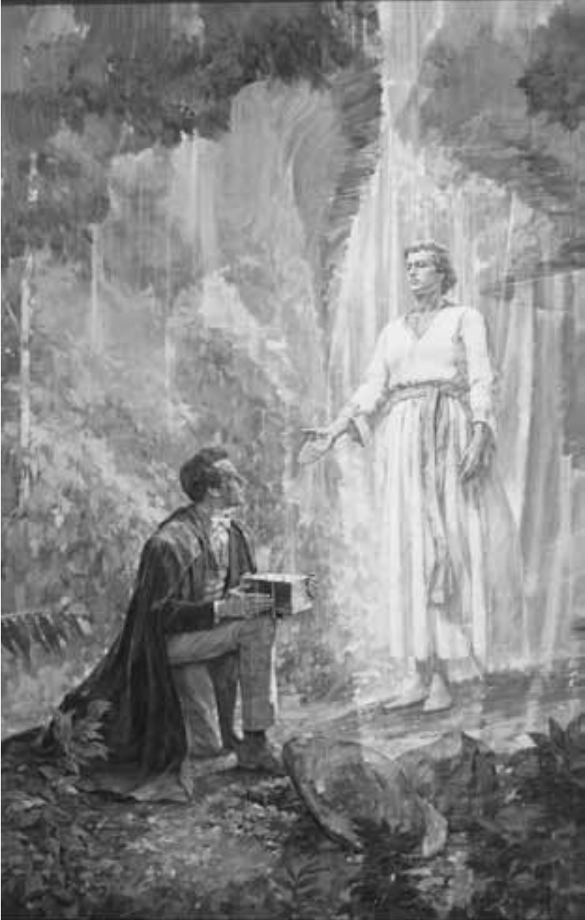
José Smith recibió las planchas de oro por mano de Moroni el 22 de septiembre de 1827. “Las obtuve”, testificó el Profeta, “junto con el Urim y Tumim, por medio del cual traduje las planchas, y así resultó el Libro de Mormón”.