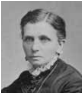
Emmeline B. Wells

Emmeline B. Wells: “No Profeta Joseph Smith, creio que reconheci o grande poder espiritual que proporcionou alegria e consolo para os santos. (...) O poder de Deus estava com ele de tal modo que em muitas ocasiões ele parecia transfigurado. Sua expressão era afável e quase como de uma criança ao repousar; mas quando discursava para as pessoas, que o amavam quase a ponto de adorá-lo, a glória de seu semblante está além de qualquer descrição. Em outras ocasiões, o grande poder de suas maneiras, mais do que o de sua voz (que era sublimemente eloqüente para mim), parecia estremecer o lugar em que estávamos e penetrar no âmago da alma de seus ouvintes e tenho certeza de que eles dariam a vida para defendê-lo. Sempre ouvi todas as suas palavras com arrebatamento: o escolhido de Deus nesta última dispensação”. 31