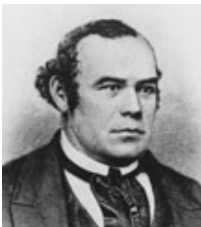
Parley P. Pratt

Parley P. Pratt, um membro do Quórum dos Doze Apóstolos de 1835 a 1857: “O Presidente Joseph Smith era pessoalmente alto e bem constituído, forte e ativo; tinha a pele clara, cabelos claros, olhos azuis, pouca barba e uma expressão que lhe era muito peculiar. (...) Seu rosto era sempre afável, de feições suaves, irradiando inteligência e benevolência; isso tudo mesclado a um