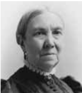
Bathsheba W. Smith

Destemida e corajosamente ele confrontou as falsas tradições, superstições, religiões, preconceitos e ignorância do mundo — provando-se verdadeiro a todo princípio revelado pelo céu — fiel a seus irmãos e fiel a Deus, e depois selou seu testemunho com seu sangue.” 7