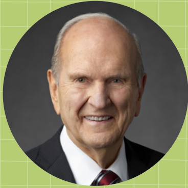
Ni Presidente Russell M. Nelson