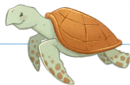
មកពី ៖ អាមេរិក សាមី

គោលដៅ និងក្តីសុំនិ ៖ ១) ចេញបេសកកម្ម ។ ២) រៀបអាពាហ៍ពិពាហ៍នៅក្នុងព្រះវិហារ បរិសុទ្ធ ។ ៣) រៀនចប់មហាវិទ្យាល័យ ។ ៤) គ្រប់គ្រងហាងនំម៉ាករបស់នាង ។