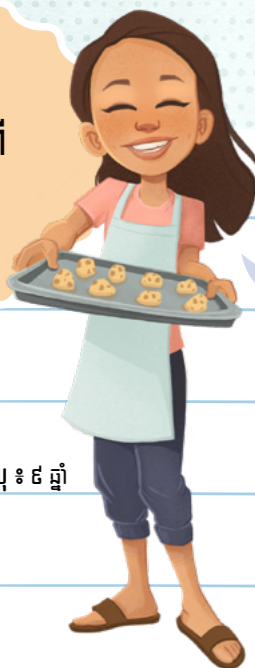
អាយុ ៖ ៩ ឆ្នាំ