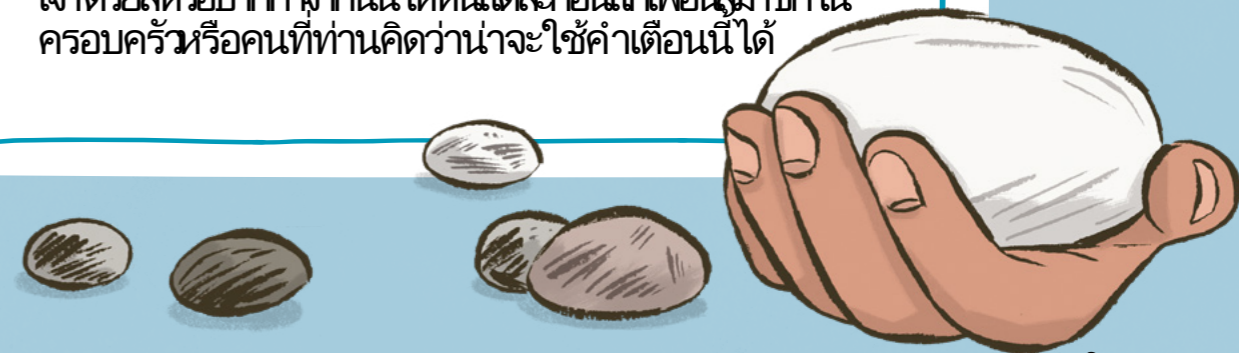
ภาพประกอบโดย เคธี่ ด็อดคริลล์

หาหินเรียบสักสองถึงสามก้อนแล้วเขียนว่าท่านเป็นลูกของพระผู้เป็น เจ้าด้วยสีหรือปากกากลากนั้นให้หินแต่ละก้อนแก่เพื่อนสมาชิกใน ครอบครัวหรือคนที่ท่านคิดว่าน่าจะใช้คำเตือนนี้ได้