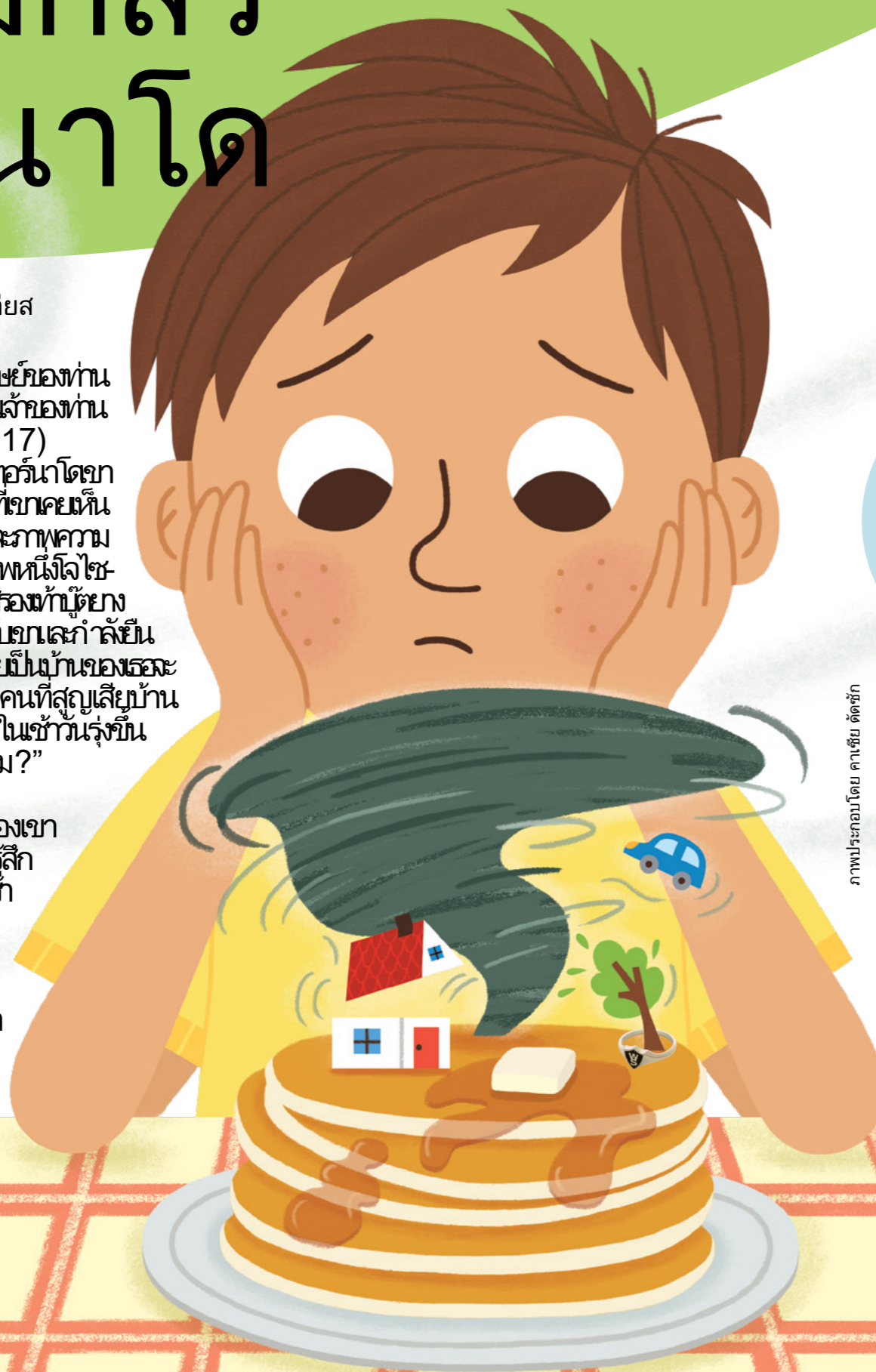
ภาพประกอบโดย คาเซย์ ดัดซัค

“เมื่อท่านอยู่ในการรับใช้เพื่อนมนุษย์ของท่าน ท่านก็อยู่ในการรับใช้พระผู้เป็นเจ้าของท่านนั่นเอง” (โมไซยาห์ 2:17) เมื่อโจเซฟได้เห็นภัยทอร์นาโดและภาพความเสียหายทั้งหมดที่เกิดขึ้นในสภาพหนึ่งโจเซฟของเขาคิดถึงทุกสิ่งทุกอย่างที่ตัวเองกำลังยืนอยู่บนกองซากปรักหักพังที่เคยเป็นบ้านของตัวเอง เกิดอะไรขึ้นกับเธอ? กับทุกคนที่สูญเสียบ้าน “ลูกดูวังนอนมากแม่กลัวในค่ำคืนรุ่งขึ้น “ลูกไม่เป็นอะไรใช่ไหม?” โจเซฟก็ยกไหล่ แม่เอามือมาแตะใบหน้าของเธอ “ไม่มีอะไรมาดูกันว่าลูกจะรู้สึกอย่างไรเมื่อรับประทานอาหารเช้า พ่อทำแพนเค้กอยู่” พ่อกำลังปั้นแป้งแพนเค้กอยู่ข้างๆเตาไฟในห้องครัวเขา เหมือนมองใครก็พึดตลอดเวลา “ได้รับความเสียหายอย่าง