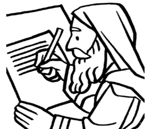
JEJE KO REKWOJARJAR