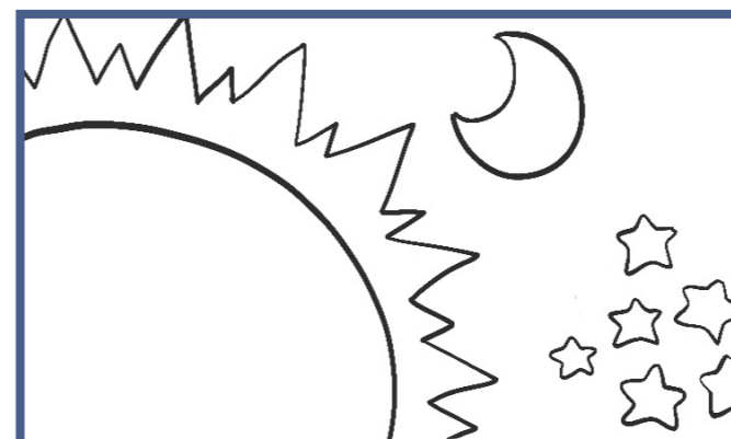
Иисус сотворил солнце, луну и звезды, дающие свет.