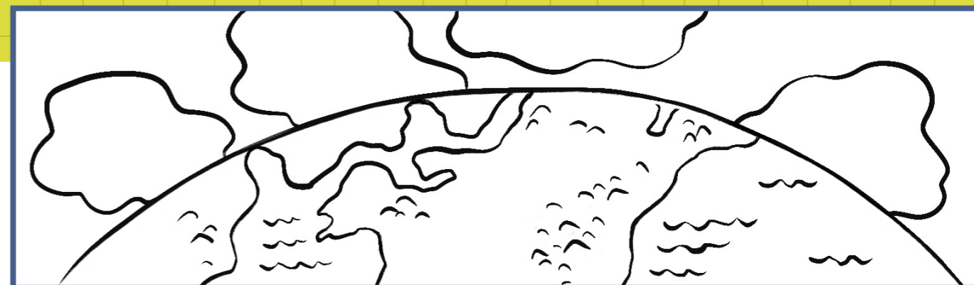
Мы жили с Небесным Отцом до нашего рождения. Он попросил Иисуса Христа создать для нас мир.

Раскрасьте картинки, чтобы узнать больше о плане Небесного Отца. Более подробную историю можно прочитать в Авраам 3–5.