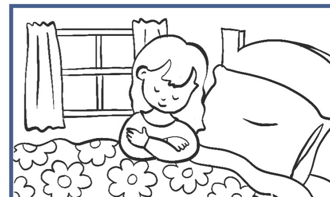
Небесный Отец любит меня и присматривает за мной.