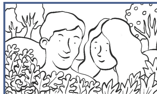
Затем Небесный Отец поместил на Землю Адама и Еву, наших первых родителей.