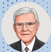
Президент М. Рассел Баллард Исполняющий обязанности Президента Кворума Двенадцати Апостолов