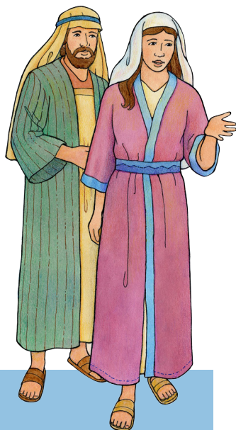
Maria og Josef