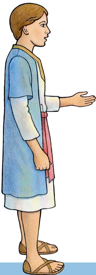
Jesus, 12 år

L im denne side fast på et stykke tykt papir eller karton. Klip derefter figurerne ud og sæt dem på træpinde eller papirposer. Gem dem i en konvolut, hvor du skriver skriftstedshenvisningen udenpå. ■ Du kan udskrive kopier fra liahona.lds.org .