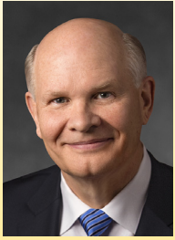
ដោយ អែលឆើ ខេល ជី អនឡាន់ ក្នុងក្រុមនៃពួកសាវ័កដប់ពីរនាក់