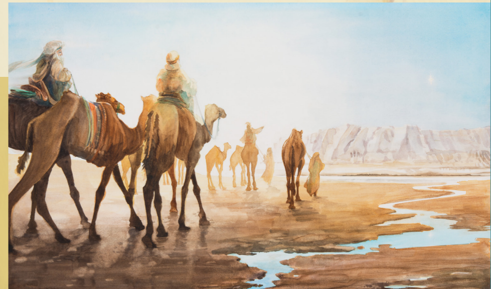
មេហ្គន វ៉ែស ហ្គេត ពួកយើងមកថ្វាយបង្គំ ទ្រង់ ( សូមមើល ម៉ាថាយ ២:១-២ ) សហរដ្ឋអាមេរិក