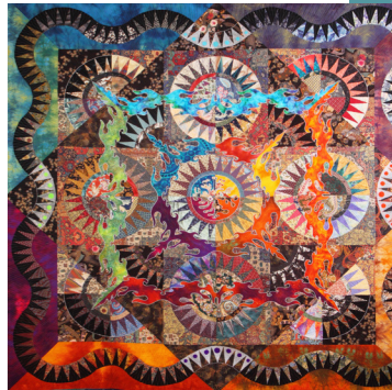
កាស្សិកូ ខ្លីងកុន ពិភពលោកដ៏ច្រើនឥត គុណនា ( សូមមើល ម៉ូសេ ២ ) ប្រទេស ជប៉ុន