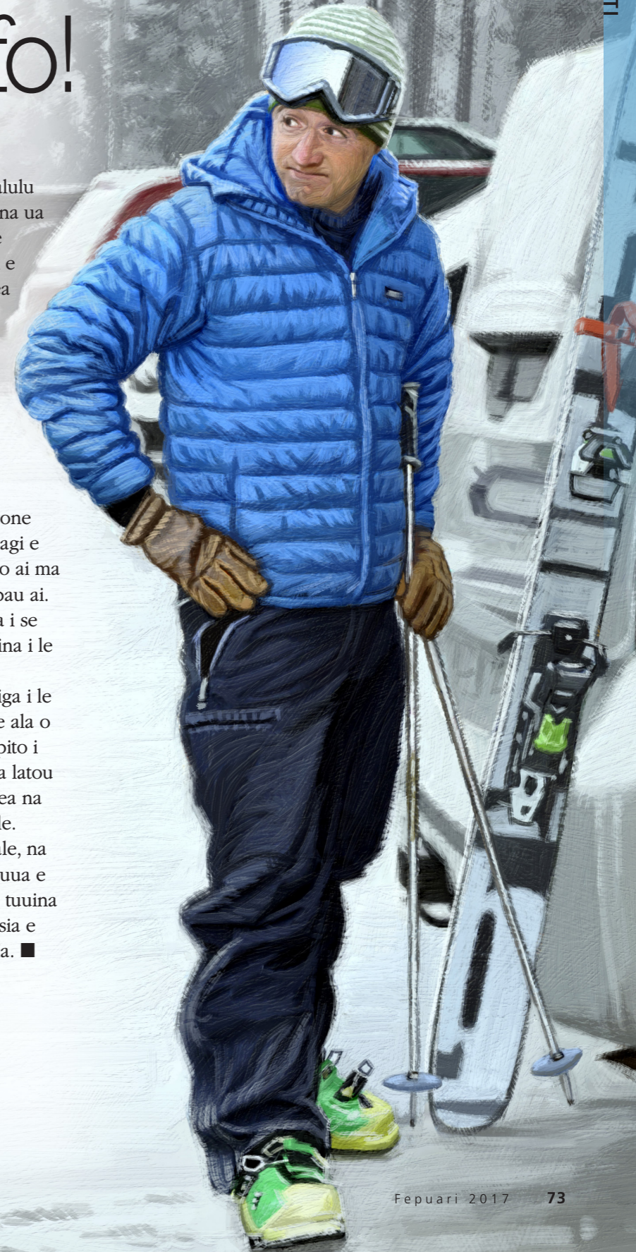
ATA NA TUSIA E DAN BURR

O le tatalo ma le mauaina o ki o le latou taavale, na faamanatu mai ai ia Elder Sitivenisone, o le a le tuua e le Tama Faalelagi i tatou e tutu i le malulu. Ua Ia tuuina mai ki ma le pule o le perisitua i taitai o le Ekalesia e fesoasoani e taitai saogalemu atu ai i tatou ia te Ia. ■