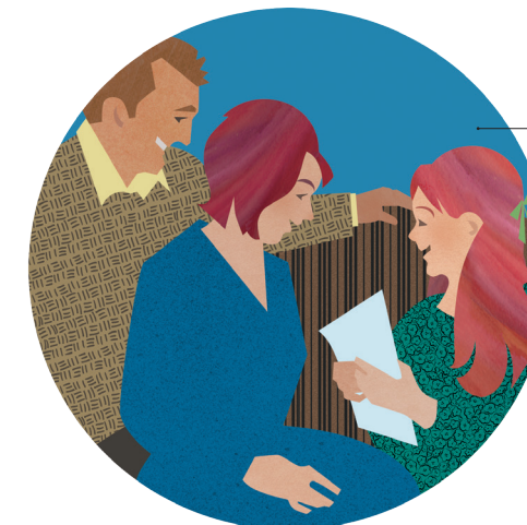
Faalogo ma le faaalua o le faaaloalo