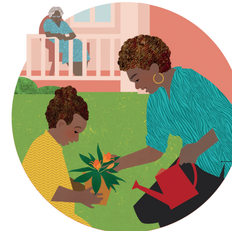
Tautua atu faamiliteli