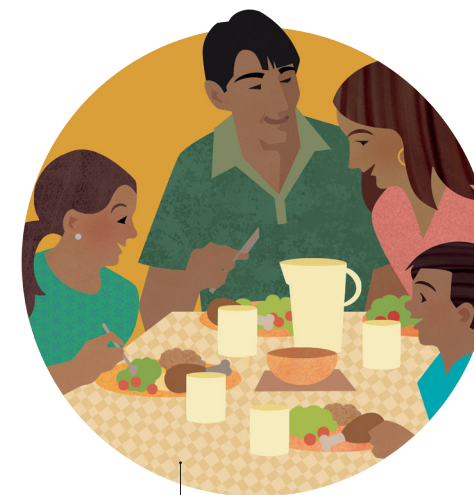
Auai i gaoioiga lelei ma tu ma aga masani faaleaiga.