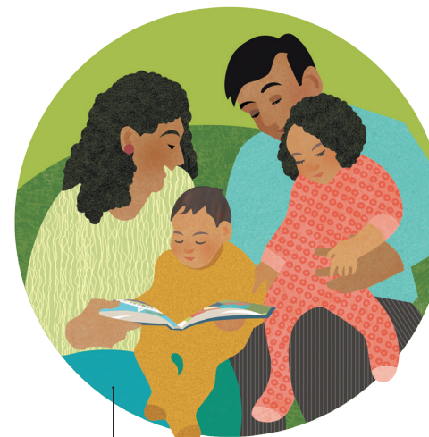
O le tapuai e ala i tatalo faaleaiga, suesueina o tusitusiga paia, afiafi faaleaiga, ma auai i le lotu ma le malumalu.