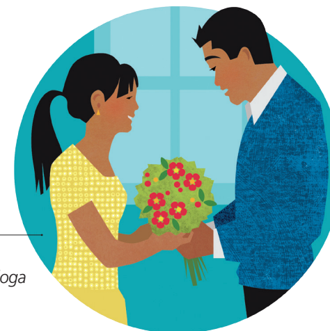
O le agalelei, faatoese, tuuina atu o le faamagaloga

E faapefea ona faamalasia sootaga faaleaiga e ala i le ola ai i le talalelei: