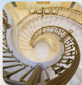
Францын Парис ариун сүм дэх мушгирсан шат