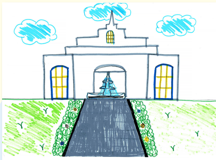
Đền Thờ Lima Peru, hình vẽ của Valeria T., 9 tuổi, Peru