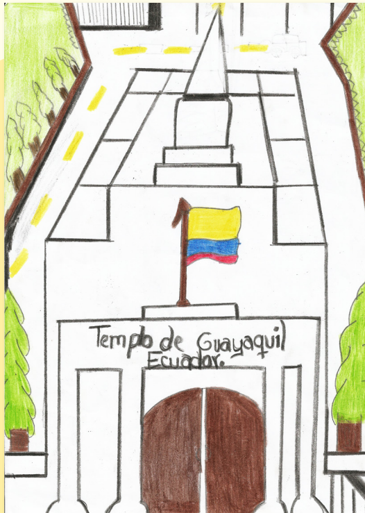
Đền Thờ Guayaquil Ecuador, hình vẽ của Landys Z., 10 tuổi, Ecuador