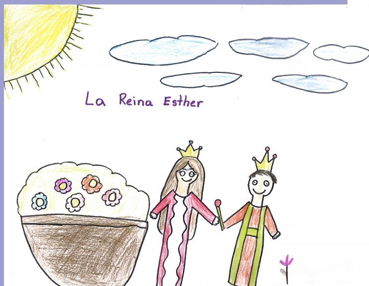
“Хатан хаан Естер,” Рэбэка К., 8 настай, Венесуэл, Арагуа

Естер Персийн хатан хаан байсан. Хаан Естерийг иудей хүн байсныг мэдээгүй. Хааны найз иудейчүүдийг үзэн яддаг муу хүн байв. Тэрээр хааныг хууран мэхэлж, газар дээрх бүх иудей хүнийг алах ёстой хэмээн хэлүүлжээ. Харин Естер хаанаас хүмүүсийг нь авраач гэж гуйхаар шийдэв. Гэвч тэр хааны сэнтийд очсоноор амиа алдах байлаа. Естер иудейчүүдээс гурав хоног мацаг барихыг хүсэв. Естерийг сэнтийд нь дөхөж ирэхэд нөхөр нь баяртай хүлээн авав. Тэр хааныг найзтай нь хамт оройн зоогонд урилаа. Тэр тэнд өөрийгөө иудей хүн болохыг хэлэв. Хаан хуулиа өөрчлөх боломжгүй байсан ч иудейчүүдэд өөрсдийгөө хамгаалах боломж олгосон байна. Бурханы тусламжтайгаар Естер өөрийн хүмүүсийг аварсан юм!