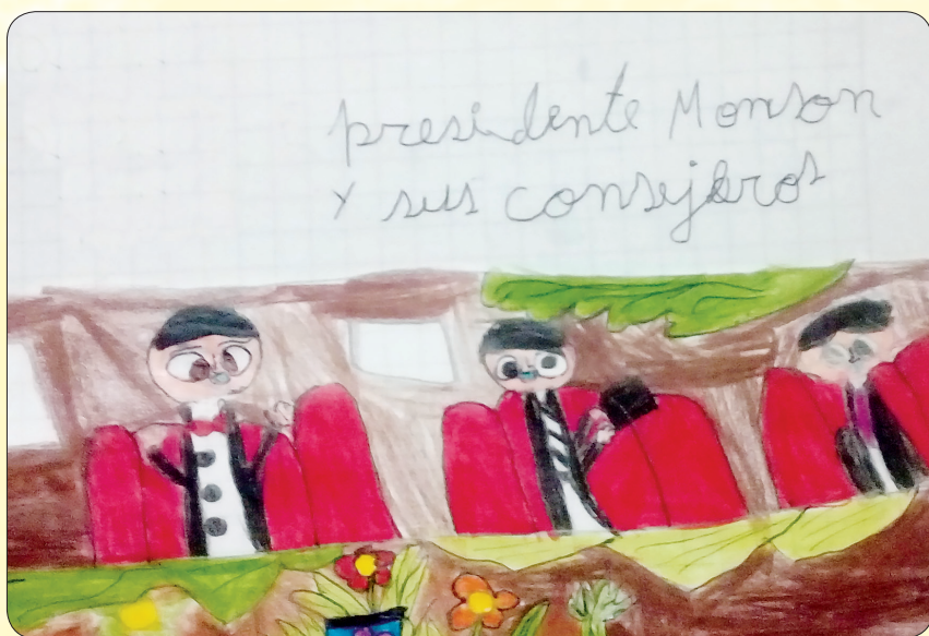
"O Peresitene Monson ma ona fesoasoani"