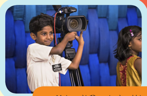
Mọi người đều vui mừng khi được nghe chứng ngôn của một Sứ Đồ của Thượng Đế!