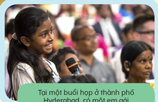
Tại một buổi họp ở thành phố Hyderabad, có một em gái được hỏi Anh Cả Bednar một câu hỏi.

"Tôi càng đi khắp thế giới, càng đi thăm nhiều quốc gia, được phước để học hỏi từ càng nhiều người, thì tôi càng thấy rằng ở khắp nơi trên thế giới, về cơ bản mọi người đều giống nhau."