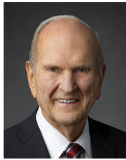
Рассел М. Нельсон Президент