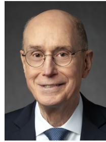
Генри Б. Айринг Второй советник