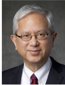
Геррит У. Гонг