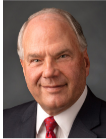
Рональд А. Расбанд