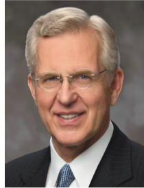
Д. Тодд Кристоферсон