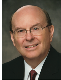
Квентин Л. Кук