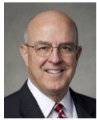
Л. Уитни Клейтон