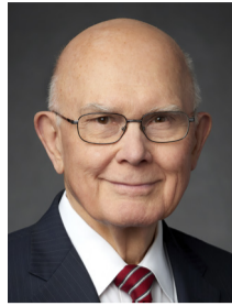
Даллин Х. Оукс Первый советник