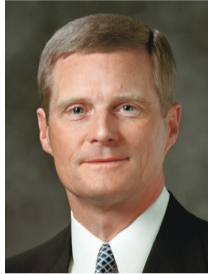
Дэвид А. Беднар