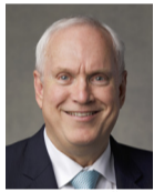
Роберт К. Гэй