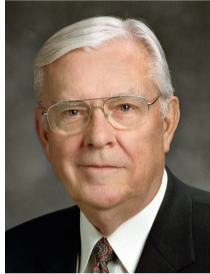
М. Рассел Баллард