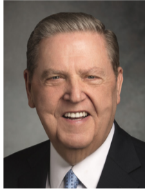
Джеффри Р. Холланд