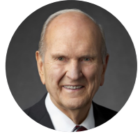
Fai 'e Palesiteni Russell M. Nelson