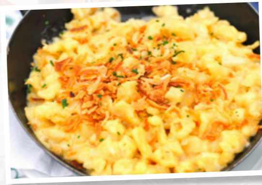
Németországban népszerű étel a savanyú káposzta, a sült kolbász és a spätzle (nokedli).