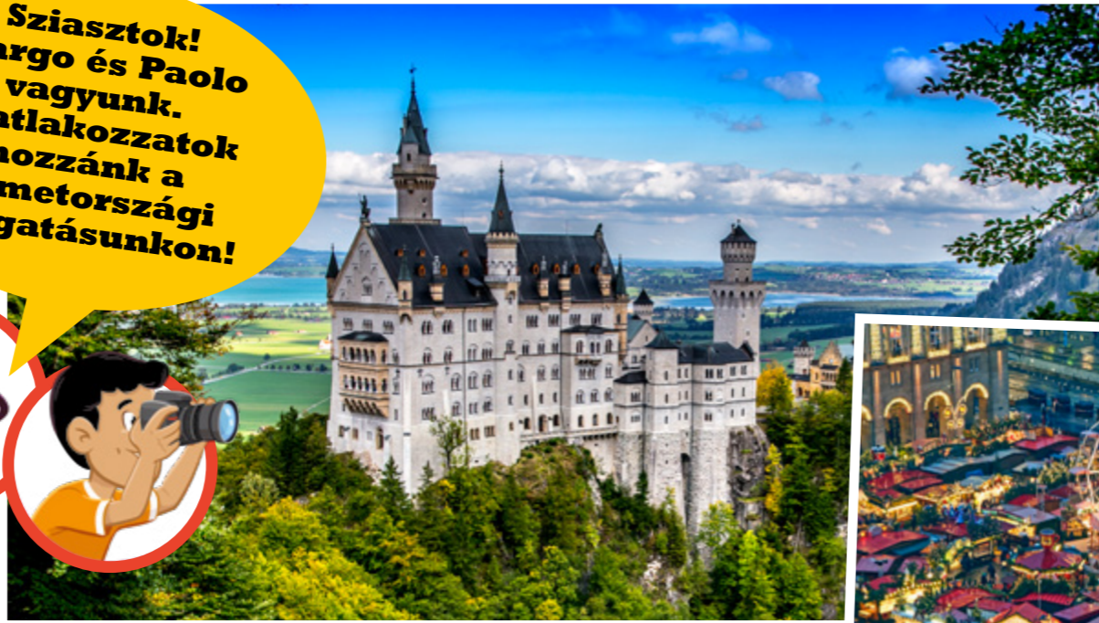
Németországban nagyjából 20 000 várkastély van. Ezek nagy része évszázadokkal ezelőtt épült. Ez itt a Neuschwanstein (Új Hattyúkő) kastély.

Németország híres a karácsonyi vásáraitól. A családok szívesen nézegetik a gyönyörű fényeket és kóstolgatják a finomságokat.