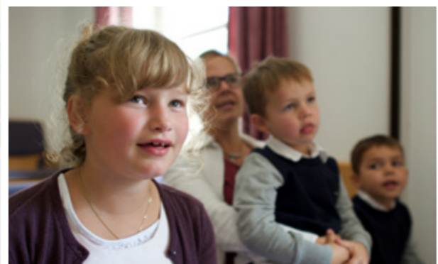
A lányok és fiúk szívesen járnak az Elemibe.

Te is Németországból származol? Írj nekünk! Szeretnénk hallani felőled!