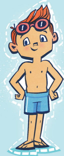
Puipui ai lou tino.