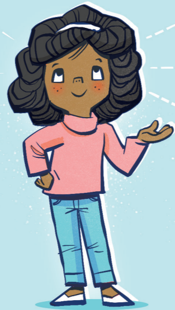
Faamanuina ai oe i le malamalama ma le olioli.

O oe o se atalii/afafine o le Atua. E tuuina mai e le Atua ia i tatou poloaiga e faamanu-iaina ai i tatou ma aumaia ia i tatou le olioli. O nisi taimi e fili-fili e tagata po o fea poloaiga latou te tausia ma po o fea e le tausia. O le taumafai e usitai i poloaiga uma a le Atua o le a: