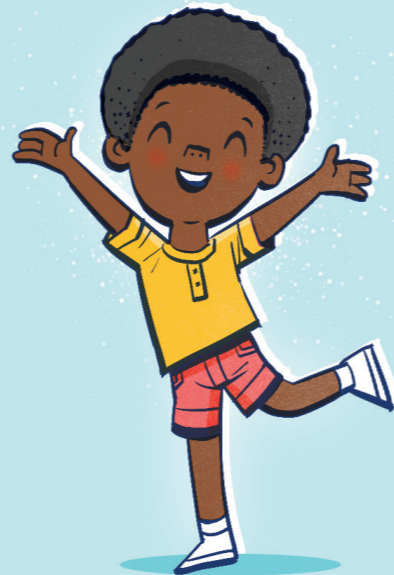
Fesoasoani ia te oe ia saoloto mai mausa leaga.