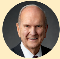
Saunia e Peresitene Russell M. Nelson