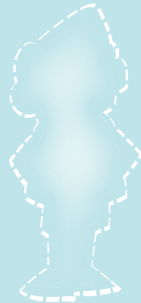
Puipui ai lou agaga.

Manatua, e i ai pea lava iina le Atua ma Ana agelu e fesoasoani ia te oe. ●