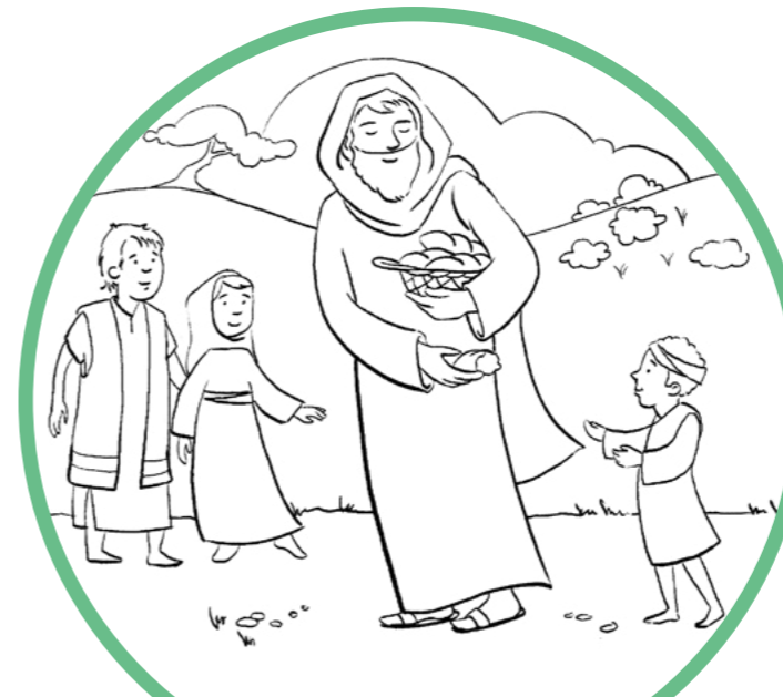
Tänker på en berättelse om Jesus.