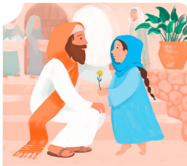
Vi tänker på Jesus och lovar att alltid minnas honom.