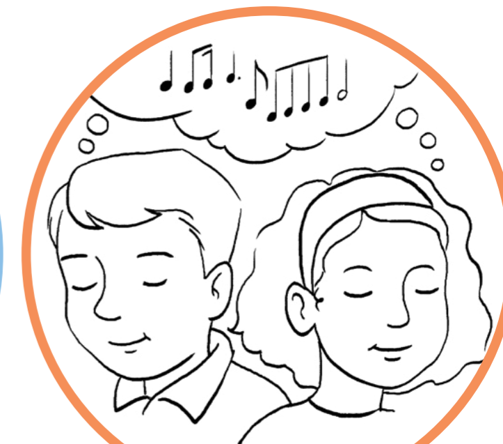
Tänker på sakramentspsalmen som jag gillar mest.