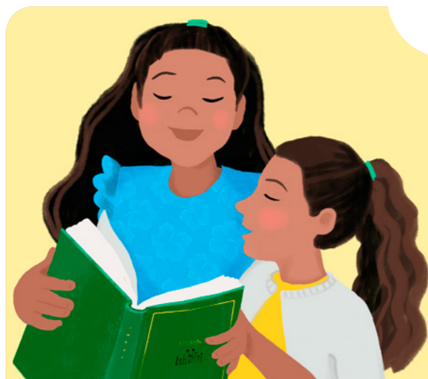
Vi sjunger sakramentspsalmen.