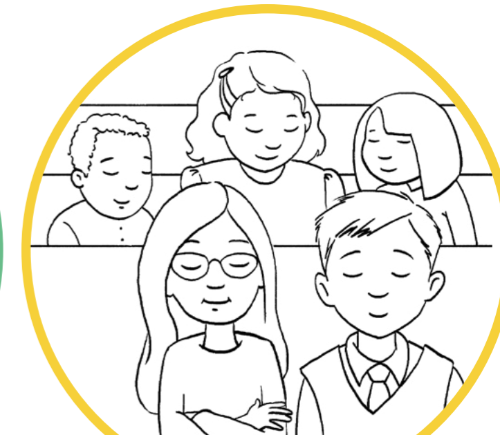
Ber till min himmelske Fader.

Sakramentet hjälper oss att känna den Helige Anden. Det hjälper oss att hålla oss kvar på stigen som leder tillbaka till vårt himmelska hem. ●