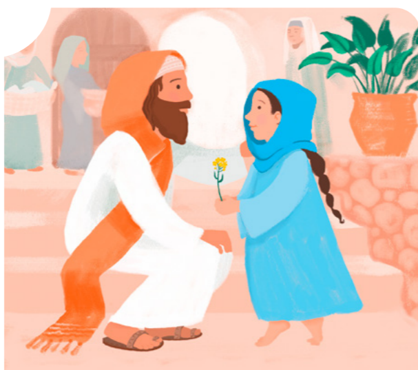
Есүсийн талаар бодож, үргэлж түүнийг санахаа амла.

Ариун ёслол бидэнд Ариун Сүнсийг мэдрэхэд тусалдаг. Энэ нь бидэнд тэнгэр дэх гэртээ эргэн очих зам дээр үлдэхэд тусалдаг. ●