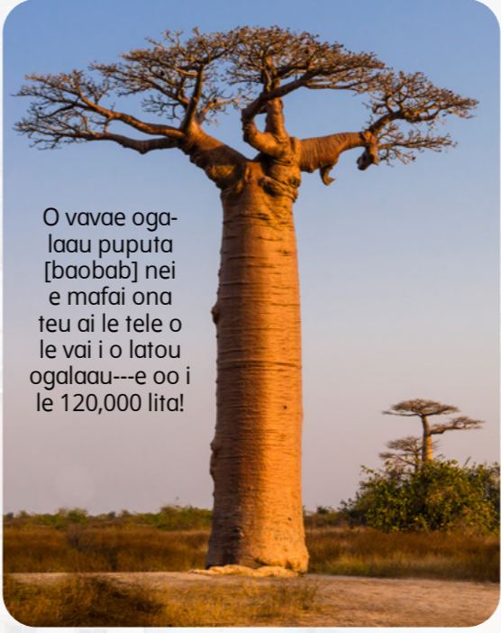
O vavae ogalaau puputa [baobab] nei e mafai ona teu ai le tele o le vai i o latou ogalaau---e oo i le 120,000 lita!