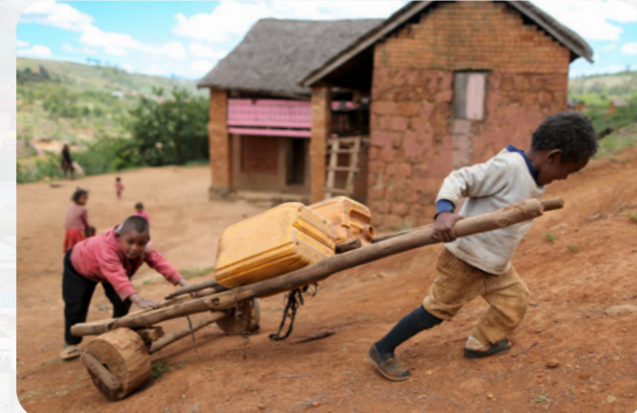
O tama nei o loo amoina fagu vai mo lo latou aiga. E faapefea ona e fesoasoani i lou aiga?