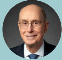
Fai 'e Palesiteni Henry B. Eyring Tokoni Ua 'i he Kau Palesitenisi 'Uluaki