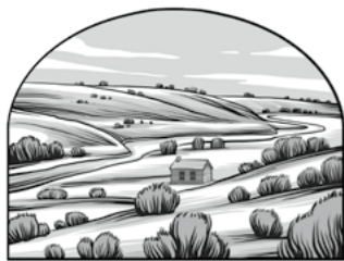
1831년의 미주리주 인디펜던스. 아. 라이먼, “시온, 그리고 그 후부터는, 회중 삼재”

디토드 크리스토퍼슨 장로, 십이사도 정원회, “시온에 오라”, 『리아호나』, 2008년 11월호, 38쪽.