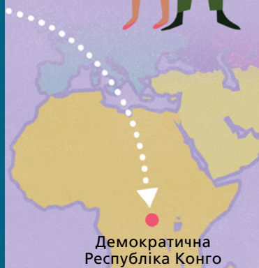
Демократична Республіка Конго