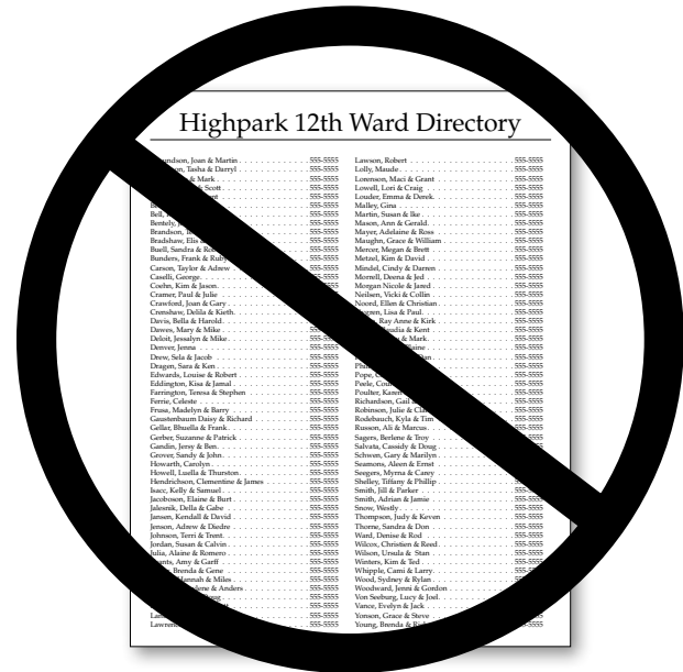
회원의 주소와 전화 번호 같은 정보가 있는 인명록은 연례 역사 보고서에 포함시키지 않아야 한다.