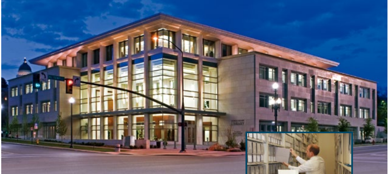
교회 역사 도서관, 유타 주 솔트레이크시티

스태이크나 지방부, 선교부 연례 역사 보고서를 작성해 제출하는 것은 주님께서 주신 다음과 같은 책임을 완수하는 데 도움이 된다. “나의 교회에 관하여 …… 중요한 사실을 모두 기록하고, 역사로 만드는 일을 계속할지며, …… 그리고 또한 세상에 널리 나가 있는 나의 종들은 자신의 청지기 직분의 보고서를 …… 보내야 하[느니라.]”(교리와 성약 69:3, 5)