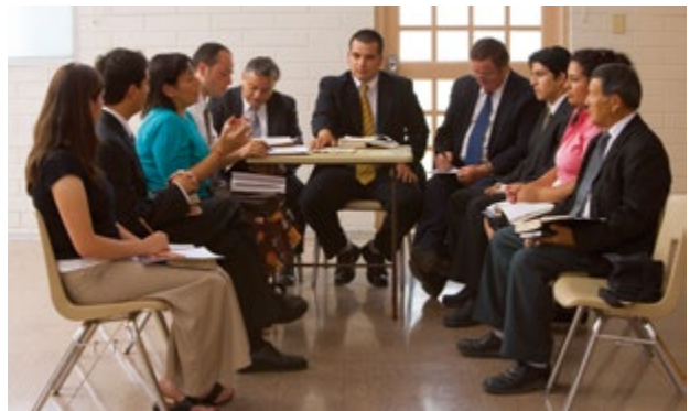
와드 평의회 회원들에게 연례 역사 보고서에 기고하도록 권유한다.

신권 조직, 보조 조직, 회원 보고서. 연례 역사 보고서는 개인과 가족이 승영에 이르도록 돕는 노력에 대해 지도자들에게 깊이 생각해 볼 기회를 준다. 이런 보고서는 단위 조직 역사에서 중요한 부분을 차지한다. 단위 조직 지도자는 이러한 정보를 쉽게 수집할 수 있도록, 신권 및 보조 조직 지도자들이 답해야 하는 몇 가지의 간단한