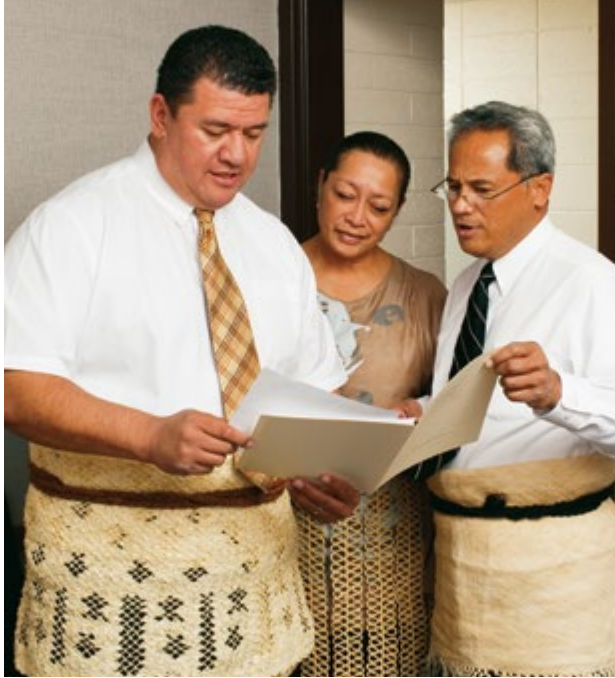
연례 역사 보고서를 제출하기에 앞서 단위 조직 신권 지도자가 검토하고 승인해야 한다.

지역 회장은 지역 사정에 맞춰 마감 날짜를 조정할 수 있다. 늦게 제출해도 접수는 되지만, 연례 역사 보고서 편찬이 연중 내내 이루어지기 때문에 현재 연도에 집중하기 위해서는 지난 해의 역사 보고서를 가능한 한 빨리 끝내는 것이 바람직하다. 연례 역사 보고서 사본 한 부를 현지에서 보관해도 좋으나 다른 곳에 배부해서는 안 된다.