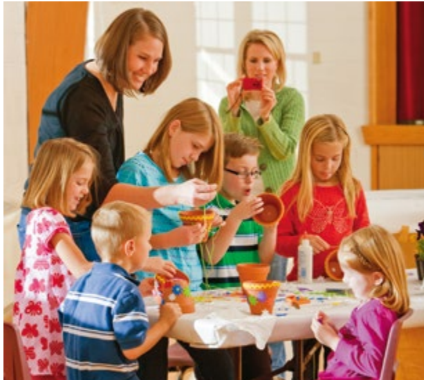
사진을 포함시키면 작성한 보고서 내용이 더 풍부해질 수 있다.

연례 역사 보고서는 또한 생활 속에서 하나님의 손길을 경험한 회원들이 1인칭 관점에서 쓴 중요한 기사를 포함할 수 있다. 회원들은 생활상이나 신앙, 일 등에 관한 이야기(교리와 성약 85:1~2 참조)를 개인 및 가족의 영적 경험 기록하기 견본을 사용하여 작성하거나 간단하게 서술하여 기록할 수 있다.(견본은 9쪽부터 시작되는 “참고 자료” 편이나 lds.org/annualhistories 에서 구할 수 있다.) 특히 여성과 청소년의 경험을 꼭 포함시킨다. 개인의 이야기를 수집할 경우, 제출자에게서 서명을 받아야 하고, 연례 역사 보고서 편찬자는 이야기의 진위 여부와 적합성을 신중하게 검토해야 한다.