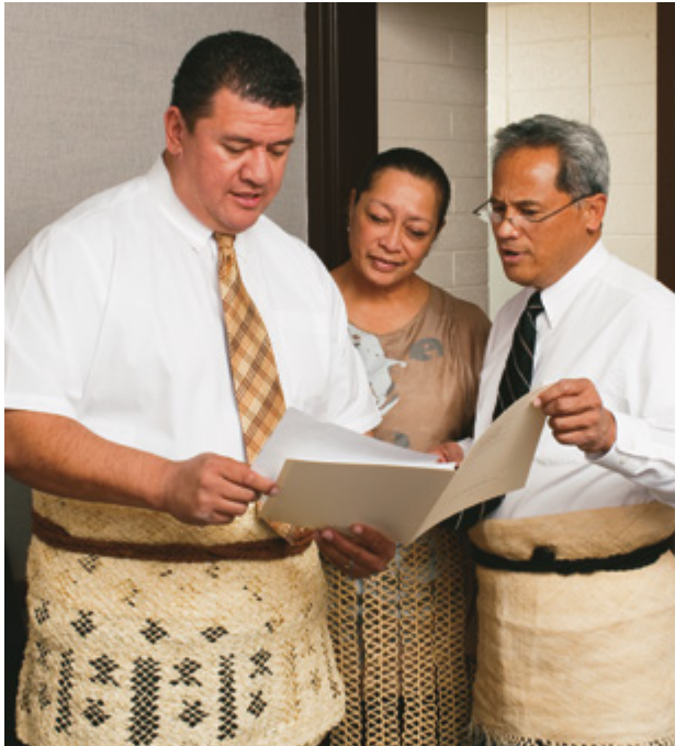
E iloiloina le talafaasolopito faaletausaga e le taitai perisitua a le iunite mo le faamaoniga a o lei auina mai.

E mafai ona fetuunai e Perisitene o Eria ia aso nei ina ia talafeagai ma manaoga o o latou eria. O le a taliaina talafaasolopito e tuai ona auina mai; peitai, ona o le tuufaatasiga o le talafaasolopito faaletausaga e faataunuaina i le tausaga atoa, e sili ai lava ona faaiuina se talafaasolopito faaletausaga mo se tausaga ua tuanai i se taimi vave lava e mafai ai ina ia mafai ona taulai atu i le tausaga o i ai nei. E mafai ona mauaina se kopi o le talafaasolopito faaletausaga i le lotoifale, ae e le mafai ona tufatufaina atu faalauaitele ia kopi.