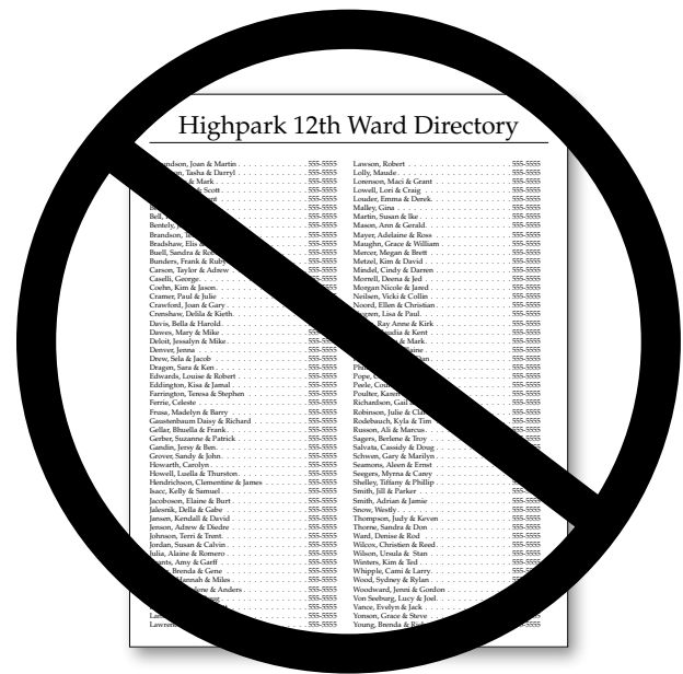
O faasinoala o loo i ai ia ituaiga faamatalaga e pei o tuatusi ma numera o telefoni a tagata e le tatau ona aofia ai i talafaasolopito faaletausaga.