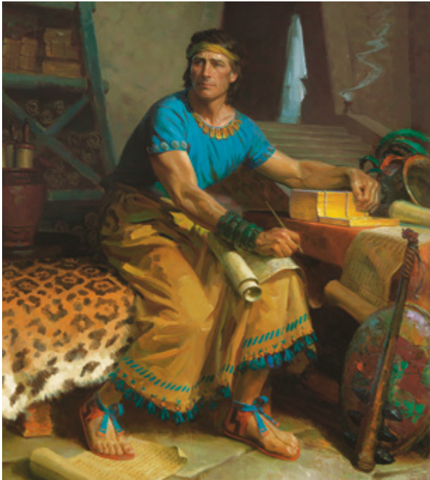
O faamaumauga ia na tuu faatasia anamua e Mamona na ave a ma se faamanuia taau mo augatupulaga mulimuli ane.

O le talafaasolopito faaletausaga e aumaia tagata ia latalata atili ia Keriso e ala i le fesoasoani ia i latou ia manatua “mea tetele na faia e le Alii” (itulau autu o le Tusi a Mamona). E faateleina le faamoemoe ma le mautinoa ona o se taunuuga o le iloaina o mea e uiga i isi o e na fetai ai ma luitau ma, faatasi ai ma le fesoasoani a le Alii, ua manumalo mai ai. O le aoao mai talafaasolopito e fesoasoani lea ia i tatou ina ia aloese mai le toe faia foi o mea sese ma maua ai se lagona o le faasinomaga ma le tupuaga. O lenei auala, ua faamanuia ai e le talafaasolopito o le Ekalesia ia augatupulaga o loo soifua faapea le lumanai.