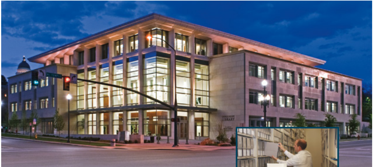
Potutusi o Talafaasolopito o le Ekalesia i le Aai o Sate Leki, Luta

O le sauniaina ma le auina atu o talafaasolopito faaletausaga o siteki, itu, po o misiona e fesoasoani lea i le faataunuuina o le poloaiga a le Alii: “Ia faaauau pea. . .ona tusitusi ma faia se talafaasolopito o mea taua uma. . . e uiga i la’u ekalesia. . . .O lenei foi, e tatau i a’u auaina o e o loo i fafo i le lalolagi ona auina atu tala o a latou matafaioi” (MF&F 69:3, 5).