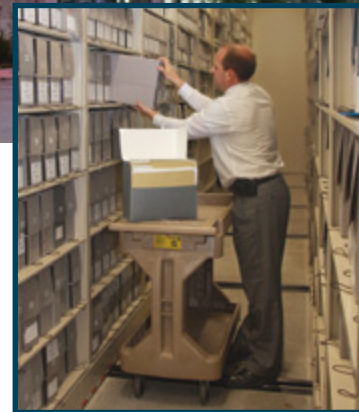
O talafaasolopito faaletausaga na auina atu o loo teuina i le Potutusi o Talafaasolopito o le Ekalesia.

I lenei taiala atoa, o le uarota ma siteki e faasino foi i le paranesi ma itu .