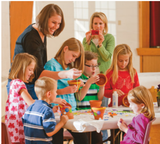
Na te mau hoho'a e faaau roa'tu i te mau parau tuatapapa papa'ihia.

E nehenehe atoa e tuu i roto i te aamu matahiti te tahi mau aamu faahiahia no roto mai i te mau melo tei farii i te iteraa no nī'a i te rima o te Atua i roto i to ratou oraraa. E ti'a ia haruharu i te mau aamu no nī'a i te huru o te oraraa, te faaroo e te mau ohipa a te mau melo (a hi'o PHPF 85:1-2) ma te faaohipa i te hoho'a o te Haruharuraa i te mau iteraa varua o te taata iho e o te utuafare , e aore ra, e nehenehe te reira e papa'i-rima-hia. ( E itehia te reira hoho'a i roto i te tuhaa « Te mau rave'a » o te haamata i te api 9 e aore ra, i nī'a i te itenati lds.org/annualhistories ). Eiaha e haamo'e i te mau iteraa o te mau vahine e te feia apī. E titauhia ia tuurima te taata haponi i te mau aamu o te taata iho, e ia hi'opo'a-maitai-hia i te ti'araa mau e te afarora e te taata e tahoē ra i te aamu matahiti.