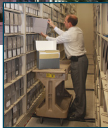
E haaputuhia te mau aamu matahiti i te Fare Aamu a te Ekalesia.

I roto i teie buka arata'i, paroitā e tītī e au atoa ia no te amaa e te mataeinaa .