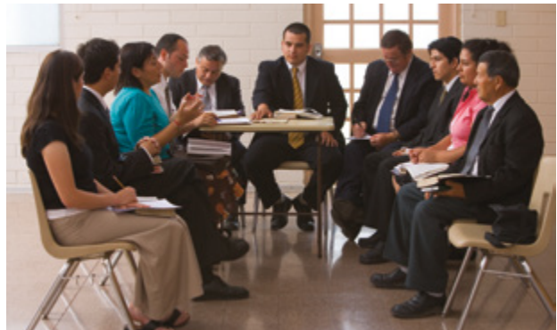
Fakaafe 'i 'a e kau mēmipa alēlea'anga 'o e uōtí ke nau tokoni ki he hisitōlia fakata'u.

Kapau 'e lava, ma'u ha foomu kuo fakamo'oni hingoa 'i 'o e Fakangofua ke Faka'aonga 'i ha 'Ū Taá ki he ngaahi tā kotoa pē pe ngaahi naunau ki he 'atá mo e leá 'oku kau 'i he hisitōlia fakata'u. 'Oku totonu ke fakapapau 'i 'e he tokotaha ngāue ki hono fakatahataha 'i e hisitōlia 'o e 'iuniti takitaha 'oku tuku mai ha fa'ahinga fakamo'oni hingoa mei he kau faitaá ki he la'itā kotoa pē pea ke hā ia 'i mui 'i he hisitōlia fakata'u. ( 'E lava ke ma'u 'a e fōmú 'i he