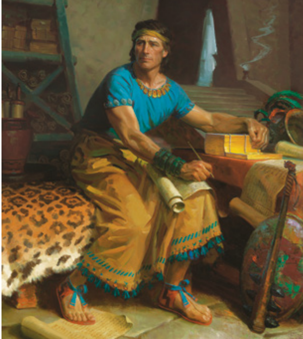
Na'e hoko 'a e lekooti na'e fakatahataha 'i he kuonga mu'á ko ha tāpuaki ta'e hano tatau ki he ngaahi to'u tangata kimui.

‘Oku ‘omi ‘e he hisitōlia fakata‘ú ‘a e kāingalotú ke nau ofi ange kia Kalaisi ‘i hono tokoni ‘i kinautolu ke nau manatu ‘i “‘a e ngaahi me‘a lahi kuo fai ‘e he ‘Eiki” (peesii talamu‘aki ‘o e Tohi ‘a Molomoná). ‘Oku tupulaki ‘a e ‘amanaki lelei mo e loto falalá ko ha ola ‘o e ako kau ki he ni‘ihi kuo nau fehangahangai mo e ngaahi faingata‘á pea, kuo nau ikuna ‘i kinautolu ‘aki e tokoni ‘a e ‘Eiki. ‘Oku tokoni ‘i kitautolu he ‘etau ako mei he hisitōliá ke tau faka‘ehi‘ehi mei hono toutou fakahoko e ngaahi fehālākí mo fakapapau ‘i ko hai au mo hoku tukufakaholó. ‘I he founzá ni, ‘oku faitāpuekina ai ‘e he hisitōlia ‘o e Siasí ‘a e ngaahi to‘u tangata he lolotonga ní mo e kaha‘ú.